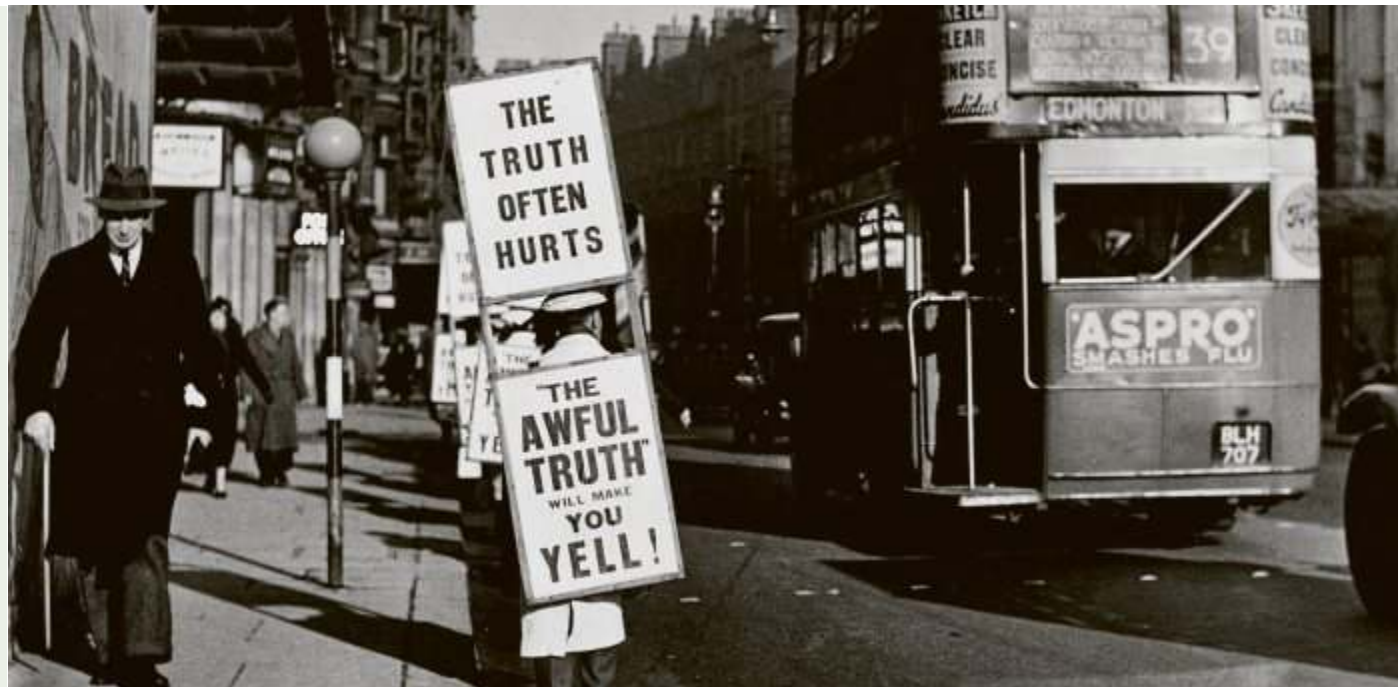
Nicht nur einer der bemerkenswertesten Vertreter des britischen Dokumentarfilms: Wolf Suschitzky „Charing Cross Road #1“, London 1936

Black Box Kalter Krieg Geschichte des Ost-West-Konflikts von 1945 bis 1990. tgl. 10-18 Ecke Friedrichstr. 47/Zimmerstr. Deutsches Historisches Museum (☎ 203040) Gewaltmigration erinnern. Twice a Stranger. tgl. 10-18 bis 18.1. Unter den Linden 2 Ethnologisches Museum (☎ 8301438) Mythos Goldenes Dreieck. Bergvölker in Südost- asien. Di-Fr 10-17, Sa+So 11-18 Lansstr. 8 Museum Dahlem (☎ 8301438) Humboldt Lab Dahlem — Probenbühne 5. Di-Fr 10-17, Sa+So 11-18 ab samstag, 19.00 Lansstr. 8 Museum der Dinge - Werkbundarchiv (☎ 92106317) Made in Germany — Politik mit Dingen. Der Deutsche Werkbund 1914. Do-Mo 12-19 bis 2.2. Oranienstr. 25